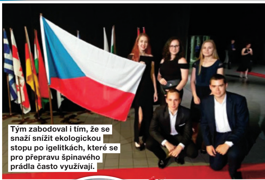
Tým zabodoval i tím, že se snaží snížit ekologickou stopu po igelitkách, které se pro přepravu špinavého prádla často využívají.